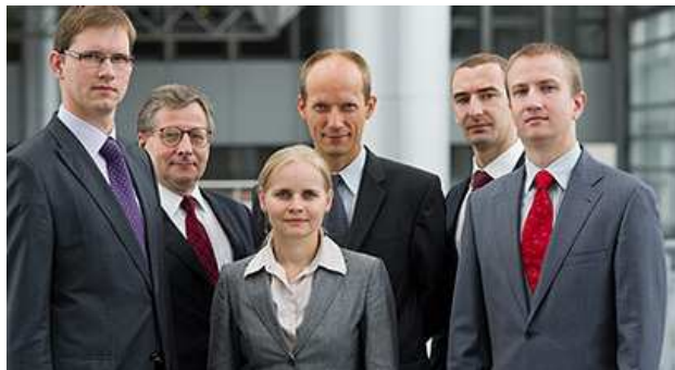
Zespół zarządzający Funduszami Inwestycyjnymi Arka

Naszą filozofię w skrócie można ująć następująco: inwestujemy w spółki, a nie w akcje. Podejmując decyzję inwestycyjną, inwestujemy tak, jakbyśmy mieli stać się współwłaścicielami w prowadzonym przez spółkę biznesie. Dlatego inwestujemy w spółki, w które naszym zdaniem warto inwestować na lata.